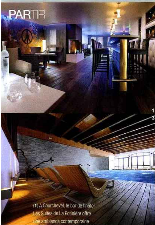
(1) A Courchevel, le bar de l'hôtel Les Suites de La Potinière offre une ambiance contemporaine raffinée. (2) L'appartement duplex de quatre cent cinquante mètres carrés aux Suites de La Potinière. (3) Au cœur du Piémont dans les Alpes italiennes, le nouveau village Club Med 4 tridents accueille un Spa by Payot avec une belle piscine intérieure. (4) A Méribel, en s'agrandissant L'Alpen Ruitor a revu toute sa décoration.